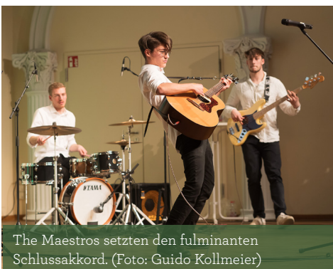
The Maestros setzten den fulminanten Schlussakkord.

Unser besonderer Dank gilt der Musikhochschule Lübeck für die beeindruckende Programmgestaltung, dem Lübecker Kolosseum und allen, die diesen Abend möglich machten! •