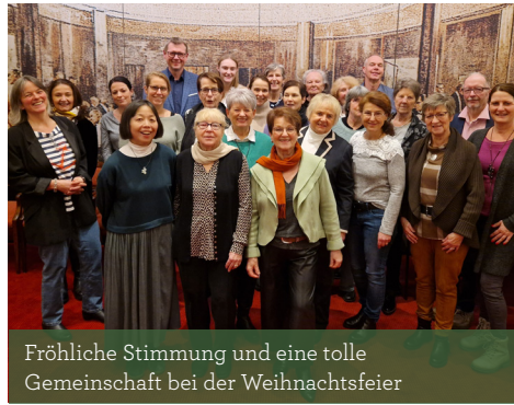
Fröhliche Stimmung und eine tolle Gemeinschaft bei der Weihnachtsfeier