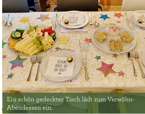
Ein schön gedeckter Tisch lädt zum Verwöhn-Abendessen ein.

Einen großen Anteil daran hat das 26-köpfige Ehrenamtsteam, das überall hilft, wo Hilfe gebraucht wird. Es wird gebastelt und gebacken, der Garten wird in Schuss gehalten, Events werden vorbereitet und vieles mehr. Vor allem aber kümmern sich die ehrenamtlichen Mitarbeiterinnen und Mitarbeiter um die Familien, sorgen für gute Laune und haben immer ein offenes Ohr für ihre Fragen und Sorgen. Eine besonders gute Gelegenheit bietet das Verwöhn-Frühstück jeden Dienstag, für das das Ehrenamtsteam verantwortlich ist, mittwochs gibt es Kuchen, und auch beim donnerstäglichen Verwöhn-Abendessen schwingen unsere ehrenamtlichen Mitarbeiterinnen und Mitarbeiter regelmäßig den Kochlöffel.